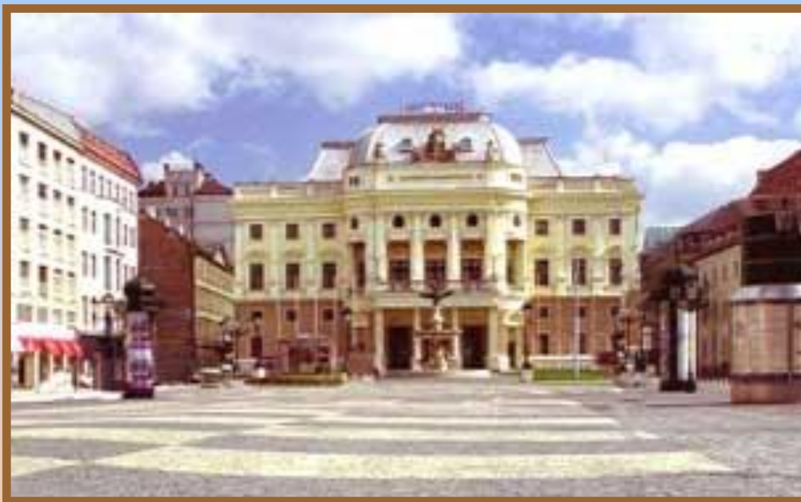
Budova SND na Hviezdoslavovom námestí