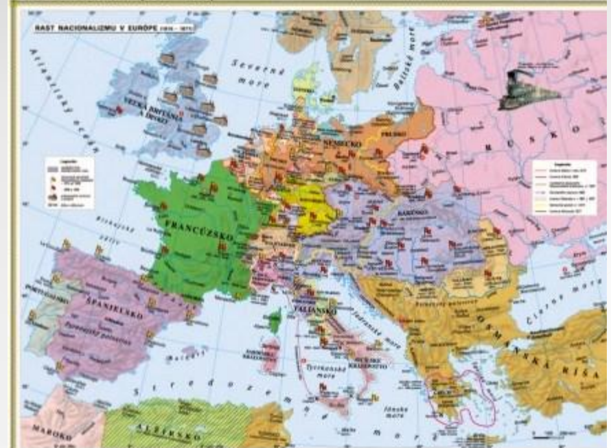
REVOLUČNÁ EURÓPA (1815 – 1871)